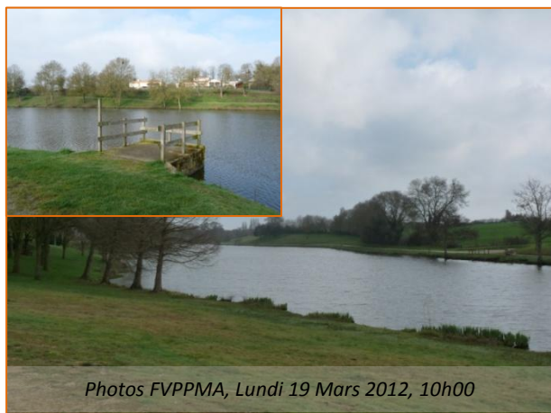
Lundi 19 Mars 2012, 10h00