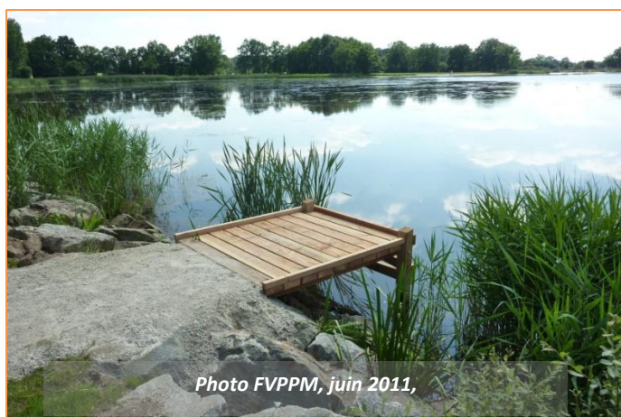
juin 2011